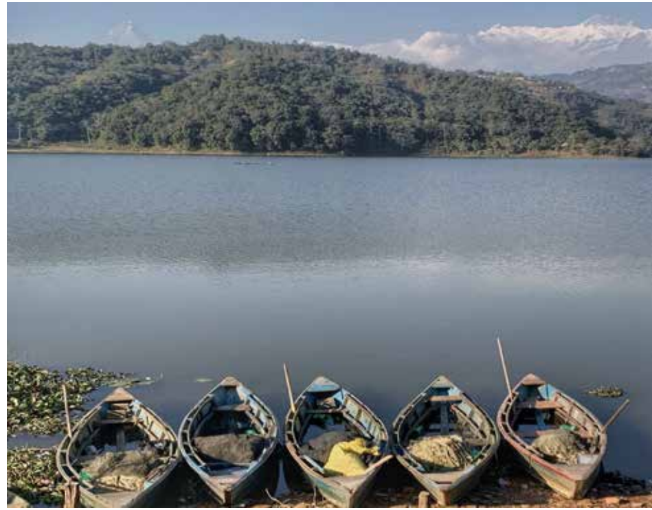
सञ्चालनमा आउन नसकेको डुङ्गा: कास्की जिल्लाको रूपा गाउँपालिकामा अवस्थित रूपाताल। कोरोना भाइरस सङ्क्रमण न्यूनीकरण गर्न सरकारले जारी गरेको निषेधाज्ञा खुकुलो भए पनि डुङ्गा सञ्चालनमा आउन सकेको छैन।

यसैबीच जिल्लाको मङ्गला गाउँपालिका-२ सिमलचौर र वडान ३ परेको सिमाना लुलीयाघाटमा म्याग्दी नदीमाथि पनि भोलुङ्गे पुल निर्माण भएको छ। करिब ९० मिटर लामो पुल निर्माणका लागि हिमशिखर-रामकृष्ण जेभीले रु २९ लाख २० हजार ७०९ मा ठेक्का लिएको थियो।