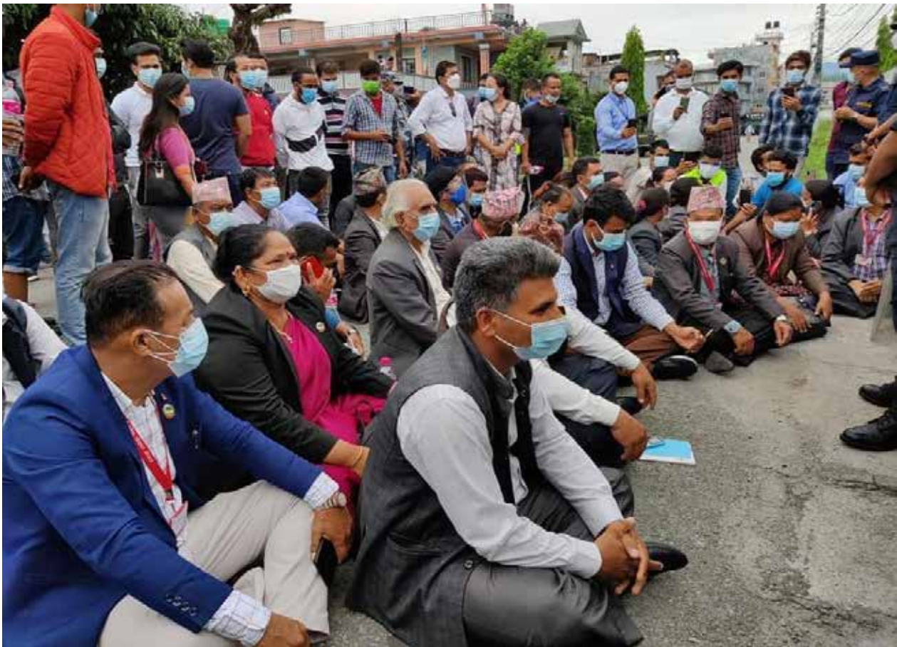
गण्डकी प्रदेश प्रमुखको निवास अगाडि विपक्षी दलहरूले धर्ना : गण्डकी प्रदेशमा मुख्यमन्त्री नियुक्तिका लागि ३१ जना सदस्यको हस्ताक्षरसहित दावी पेश गरेका दलहरूले ढिला सुस्ती गरेको भन्दै गण्डकी प्रदेश प्रमुखको निवास अगाडि धर्ना दिएका थिए।