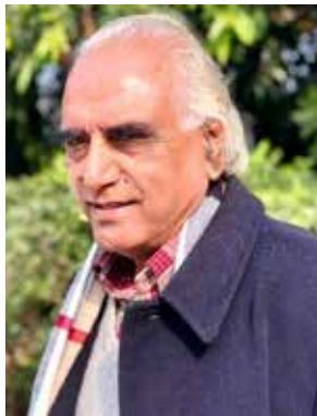
भाइ अमेरिकामा बस्दै आउनुभएको छ ।