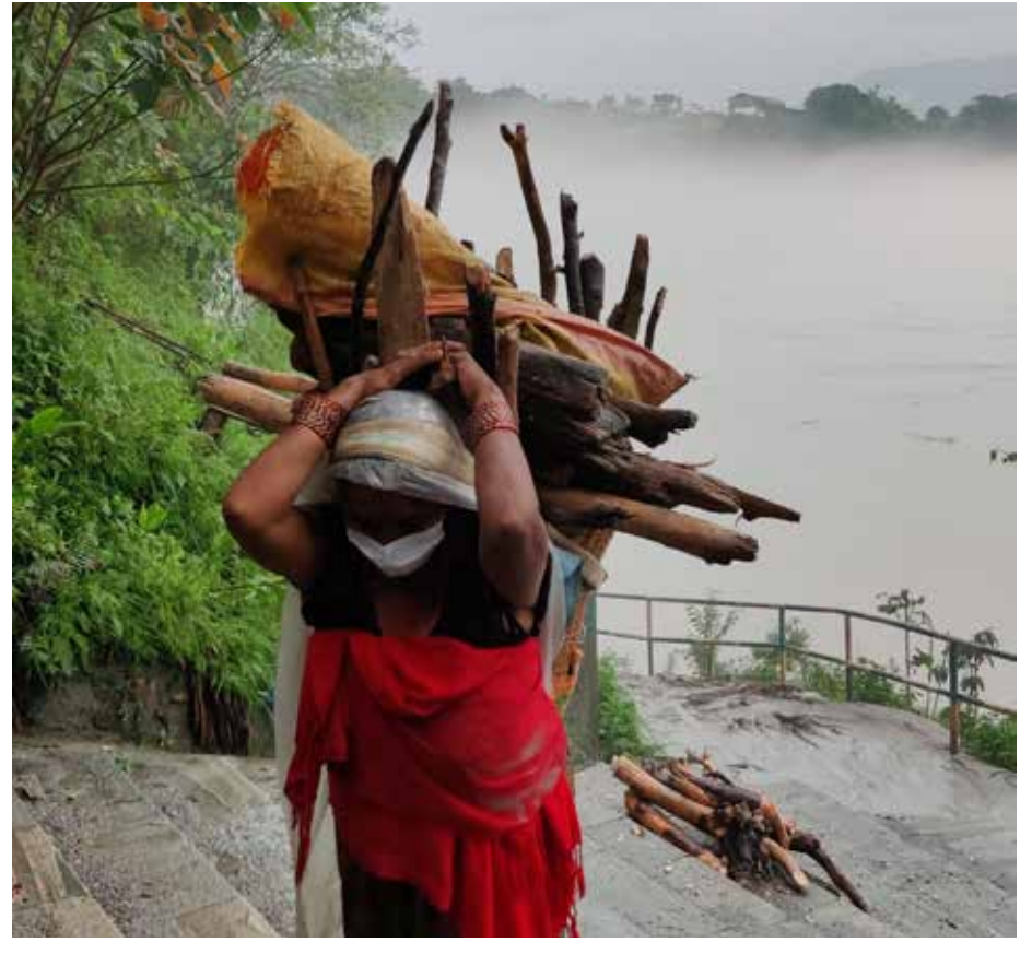
घरतर्फ दाउरा लार्गिंद: अवरिल वर्षाका कारण पोखराको रामघाटमा सेती नदीले बगाएर ल्याएको दाउरा बटुलेर घरतर्फ लौजाँदै स्थानीयवासी ।

प्रदेशको मुख्य आन्तरिक आम्दानीमा मालपोल, घर जग्गा दर्ता वापत प्राप्त हुने राजश्व बाडफाँडबाट प्राप्त हुने रकम तथा यातयात क्षेत्र, व्यक्तिमा आधारित कर, पर्यटन कर विज्ञापन कर, जस्ता करको प्रशासन गर्न प्राकृतिक श्रोतसाधनमा लाग्ने कर लगायतका रहेको केसीले जनाए । पोखरा क्षेत्रमा उल्लेखनिय रुपमा पर्यटकीय गतिविधि गर्ने स्थल भए पनि यहाँबाट हालसम्म पयाप्त मात्रमा कर अशुलन नसकिएको उनले गुनासो गरे । त्यसलाई अब कानुन नै बनायर करको दायरामा ल्याउनु पर्ने उनको भनाई छ ।