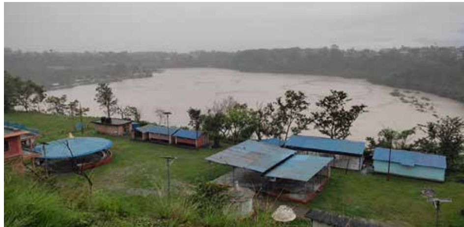
अविरल वर्षाका कारण पोखराको रामघाटमा सेती नदी थुनिदा बनेको ताल