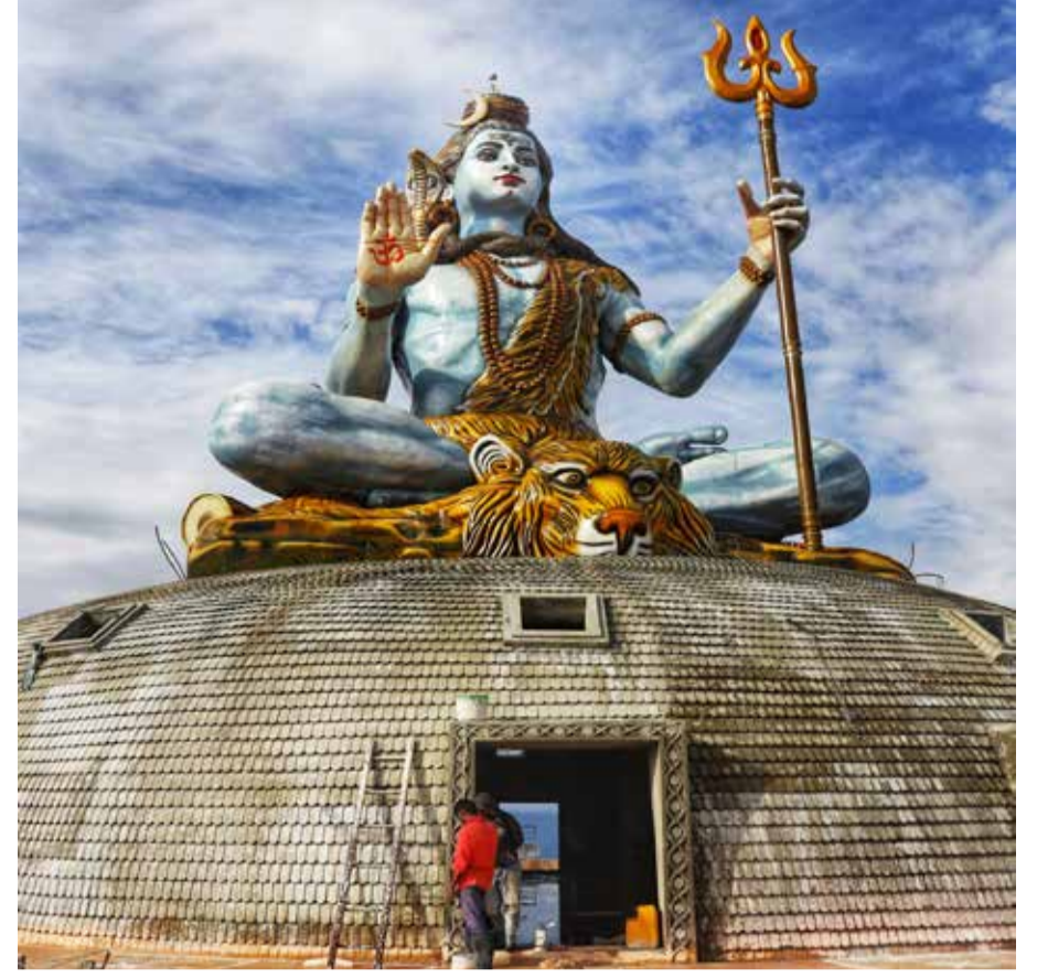
महादेवको मुर्ति: पोखरा महानगरपालिका वडा नं २२ पुम्दीकोटमा निर्माणाधीन महादेवको मुर्ति। निर्माणको काम नसाकेँदै आन्तरिक पर्यटकको चहलपल बढ्न थालेको छ।

उक्त सामग्रीहरू संस्थाको उपस्थितिमा सम्बन्धित गाँउपालिकाहरूमा गाँउपालिका अध्यक्ष तथा स्वास्थ्य शाखा