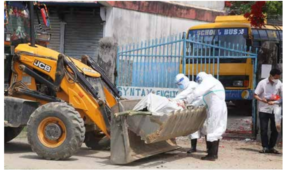
शव व्यवस्थापनको तयारी: तनहुँको देवघाट गाउँपालिका-५ निवासी एक महिलाको कोरोनाबाट मृत्यु भएपछि सोमबार शव व्यवस्थापनको तयारी गरिँदै। आइतबार राति मृत्यु भएकी महिलाको सोमबार प्राण रिपोर्टमा कोरोना पुष्टि भएको थियो।