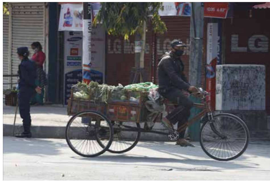
एक व्यवसायी : तरकारी बिक्रीका लागि चिप्लेढुङ्गा बजारमा हिँडेका एक व्यवसायी।

मन्त्रपरिषदले ग्रामीण क्षेत्रमा २०० र शहरी क्षेत्रमा ५०० कोरोनाका सक्रिय संक्रमित पुगेसँगै निषेधाज्ञा लगाउन सक्ने अधिकार स्थानीय प्रशासनलाई प्रत्यायोजन गरेको छ। सोही अधिकारको प्रयोग गर्दै स्थानीय प्रशासनले जिल्लाभर वा प्रभावित क्षेत्रमा निषेधाज्ञा लगाउँदै आएका छन्।