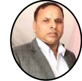
पोखरापत्र संवाददाता बागलुङ, २४ बैशाख

यसबीचमा नेकपाका दुवै समूहले प्रधानमन्त्रीवरुद्ध प्रतिनिधिसभामा अविश्वासको प्रस्ताव पेश हुने र त्यसमाथि मतदान हुने अवस्था आएमा नेपाली कांग्रेस र जनता समाजवादी पार्टी जसपाको साथ पाउने आशा व्यक्त गर्दै आएका देखिन्छन् जुन स्वभाविक नै हो। तर के उनीहरूले आशा गरेभन्ने कांग्रेस र जसपा कुनै समूहको पक्षमा उभिन तयार होला त यो प्रश्न पनि सबैले गर्न