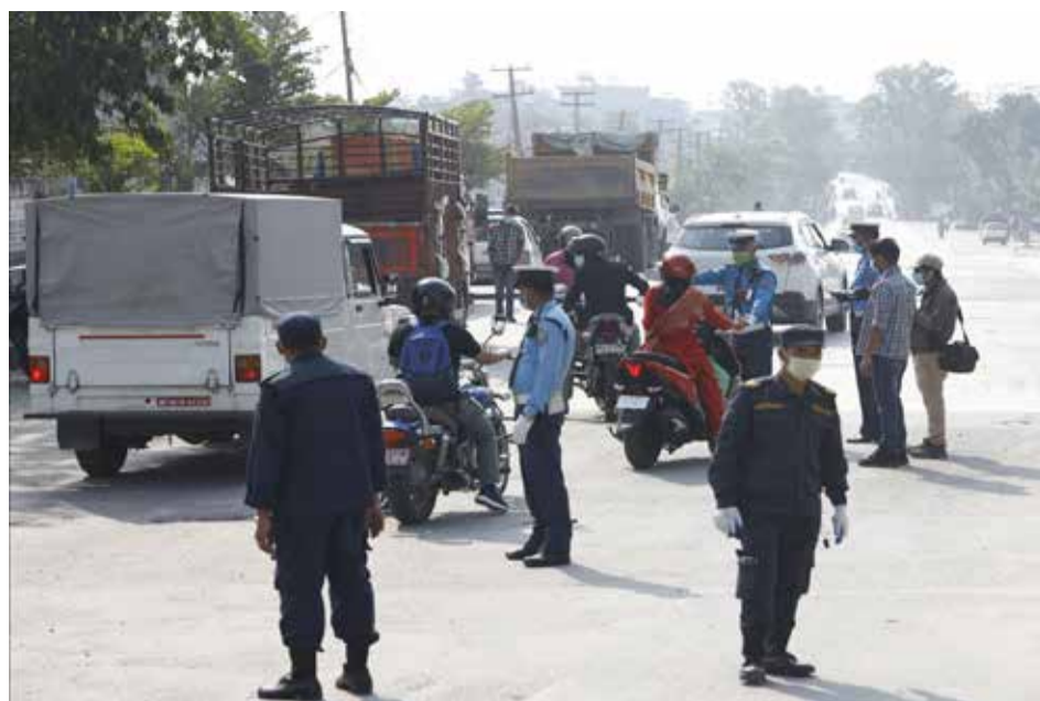
सुरक्षा जाँच गरिँदै : पछिल्लो समय कोरोना भाइरसलगायतका संक्रमण बढेपछि जिल्ला प्रशासनले केही दिनका लागि जारी गरेको निषेधाज्ञाको अवधिमा पृथ्वीचोकमा सुरक्षा जाच गर्दै सुरक्षाकर्मी।