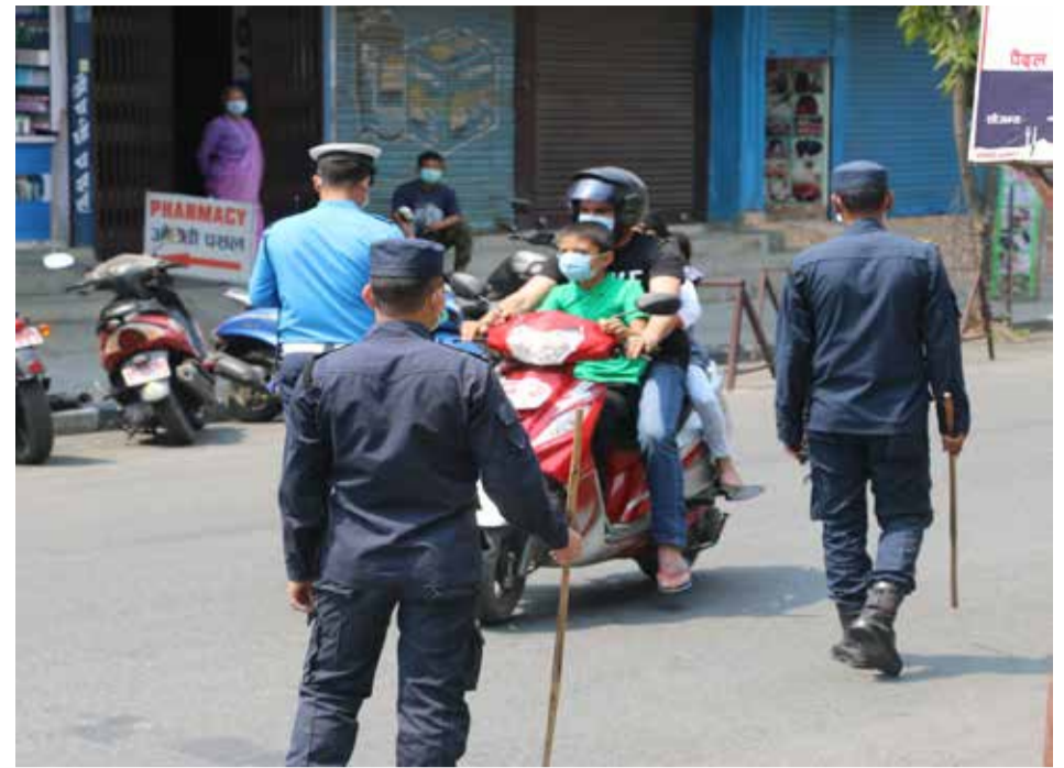
चेकजाँच गर्दै सुरक्षाकर्मी : पोखरा महानगरपालिका वडा नं ६ हल्नचोकमा निषेधाज्ञाको तेस्रो दिन चेकजाँच गर्दै सुरक्षाकर्मी।

र हिमाली जिल्लामा २०० र काठमाडौं उपत्यका तथा तराईमा ५०० सक्रिय सङ्क्रामित रहेका जिल्लामा जिल्लाभर वा निश्चित क्षेत्र तोकरी प्रमुख जिल्ला अधिकारिले निषेधाज्ञा वा अन्य आवश्यक आदेश जारी गर्न सक्ने अधिकार दिएको थियो। सोही अधिकार प्रयोग गर्दै बाँके, सुर्खेत, काठमाडौं, ललितपुर, भक्तपुर, कास्की, कैलाली, पर्सा, कञ्चनपुर, दाङ, पाल्पा, चितवन, रुपन्देही, र सुनसरीमा आदेश कार्यान्वयनमा छ। यस्तै, कालीकोट, बालुङ, बर्दियामा र दार्चुलामा आंशिक आदेश जारी भएको छ। आदेश जारी भएका जिल्ला मध्ये कास्की, सुनसरी र भापामा सवारी साधनलाई जोरबजोर प्रणालीमा सञ्चालन गरिने उल्लेख छ।