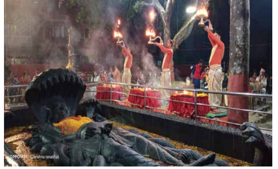
एक वर्षपछि : कोरोना महामारीका कारण स्थगित पोखरा-१७, छोरेपाटन स्थित गुप्तेश्वर महादेव गुफा परिसरको महाआरती गत सोमबार पहिलो पटक गरिएको थियो।