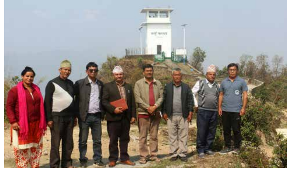
पर्यटकीय स्थल काहुँडाँडा: पर्यटकीय स्थल काहुँडाँडामा पछिल्लो समय आन्तरिक पर्यटकको आकर्षण बढेको छ।