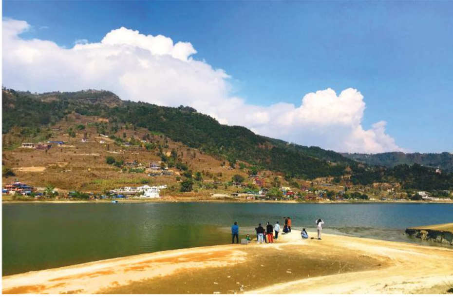
फेवातालमा रमाउँदै पर्यटक: पोखराको फेवातालमा रमाउँदै आन्तरिक पर्यटक।